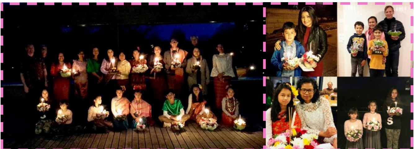
ภาพกิจกรรมงาน ประเพณีลอยกระทง ทะเลสาบเมืองคาม

นอกจากนี้ ทางโรงเรียนก็ยังมีกิจกรรมของวันพิเศษในเทศกาลออกไข่ของชาวยุโรป มาฝากด้วย วันอีสเตอร์ Easter หรือ Pascha ในภาษากรีกและลาติน เป็นวันสำคัญที่สุดวันหนึ่งของศาสนาคริสต์ เพื่อระลึกถึงการฟื้นคืนชีพของพระเยซู 2 วัน หลังจากสิ้นพระชนม์บนไม้กางเขน ในปี 2017 นี้ วันอีสเตอร์ตรงกับ วันอาทิตย์ ที่ 16 เมษายน ในนิกายโรมันคาทอลิกและโปรเตสแตนต์ วันอีสเตอร์จะตรงกัน ส่วนนิกายออร์ทอดอกซ์นั้นบางปีจะไม่ตรงกัน