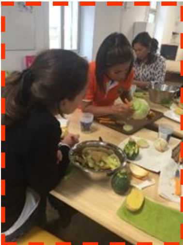
งานสอนการแกะสลัก