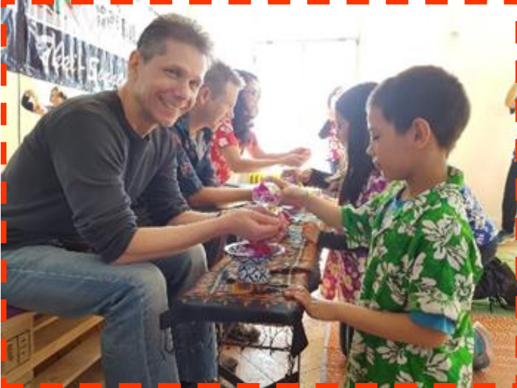
งานสงกรานต์ วันขึ้นปีใหม่ไทย

ในแต่ละปีวันสงกรานต์จะจัดขึ้น ช่วงสัปดาห์ที่สองของเดือนเมษายน มี การสงน้ำพระ รตหน้าดำหัวผู้ใหญ่ และสังสรรค์ระหว่างผู้ปกครอง ครู และนักเรียน อีกทั้งยังมีการเรียนรู้นอกสถานที่ เช่น การไปทัศนศึกษาในที่ต่าง ๆ นอกจากนี้ การสอนทำอาหารไทย การแกะสลักผักผลไม้ก็เป็นอีกหนึ่งกิจกรรม ที่ทางโรงเรียนจัดทำขึ้นเพื่อคนในท้องถิ่น