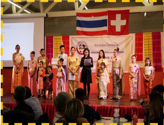
งานประจำปีโรงเรียน ปี 2560